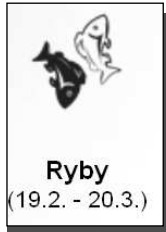
Ryby (19.2. - 20.3.)

také hrozné a pomoc nenájdete len pre seba, ale veľmi dobre poradíte aj druhým. V prvej polovici roka zaberie na plné obrátky a hoci už toho bude chvíľami až príliš, skúste vytrvať, pretože už v júli príde sladká odmena. Čaká vás aj jedno veľké poznanie z kruhu rodiny a možno nebude príjemné, ale ak zachováte chladnú hlavu, uvidíte riešenie. Nezatracujte niekoho len preto, že pochybil, obzvlášť, ak toho úprimne ľutujete. Do dedičských konaní sa však tento rok určite nepúšťajte, v tomto smere je ešte potrebný nejak čas nechať veci dozrieť. Aj v zdraví sa dočkáte noviniek, prvé problémy nastanú hneď po jari, ale z diagnózy lekára nemusíte robiť koniec sveta. Berte to ako upozornenie a poučenie, že vaše zdravie si zaslúži vašu každodennú pozornosť.