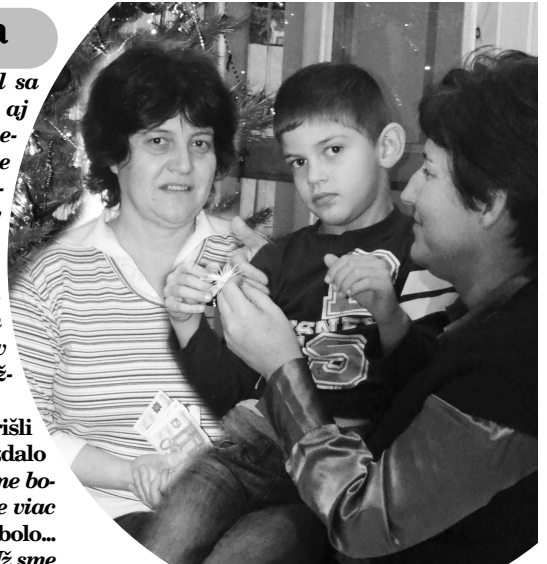
Adamko je úplne odkázaný na pomoc a lásku mamy a celej rodiny

"V tom prvom roku som si hovorila - keď už bude chodiť, bude dobre. V dvoch rokoch, keď začal chodiť, tešili sme sa. To však prišla epilepsia a to taká, že sme končili v nemocnici. Mával štyridsaťminútové záchvaty. Pri prvom sme sa strašne zľakli. Našťastie, lekára sme mali v susedstve, ten to veľmi rýchlo rozpoznal." Nasledovala séria vyšetrení a CTčko potvrdilo epileptické ložisko v mozgu. "Lekári zistili, že má poškodené ko-