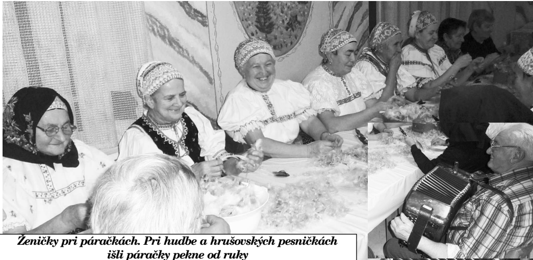
Ženičky pri páračkách. Pri hudbe a hrušovských pesničkách išli páračky pekne od ruky

K zimným mesiacom na Slovensku v minulosti neodmysliteľne patrili aj páračky. Ženičky z dediny sa zišli u niektoej z nich a párali perie. To sa potom rôzne využívalo. Či už do vankúšov, alebo perín a podobne. Počas spoločného posedenia sa prebrali rôzne novinky z obce i okolia a rozprávali sa zaujímavé príbehy, rozprávky i legendy. Zaslú slávu dedinských páračiek sa rozhodli obnoviť v Hrušove. A podujala sa na to Miestna organizácia Slovenského zväzu zdravotne postihnutých (MO SZZZP).