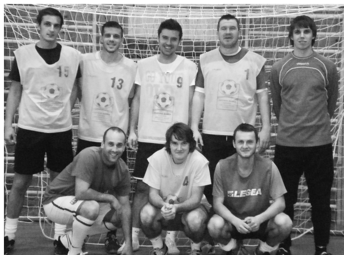
Nepopulárna zemiaková pozícia sa ušla Krupinčanom