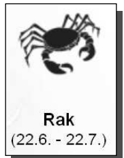
Rak (22.6. - 22.7.)

priznať svoje omyly, ste predsa len človek a aby ste mohli začať znova, musíte to urobiť s čistým štítom. Neuvážené kroky z minulosti nech sú vám ponaučením a rovnako sa nezabudnite spoľahnúť na pomoc tých, ktorým dôverujete. Prvý polrok sa bude niesť v znamení pokušenia, ako v práci tak i v súkromí a dokonca aj v otázke financií a je len na vás, kam až si dovoľíte zájsť. V medziľudských vzťahoch sa tento rok budete musieť naučiť načúvať potrebám iných a prehodnotiť niektoré svoje zásady. Nerozhodujte sa však príliš rýchlo, impulzivnosť by sa vám nevyplatila. Lepšie je dopriať si čas, nech veci vidíte jasnejšie, preto všetky zásadné zmeny v živote presuňte až na druhý polrok. Pozor si dajte aj na neprajníkov, ktorých máte vo svojom okolí ešte stále dosť. Ak niekomu naozaj nedôverujete, tak si ho pokojne vyskúšajte a preverte, na koľko stojí na vašej strane.