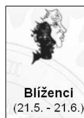
Blíženci (21.5. - 21.6.)

Rok 2014 bude pre vás rokom zmien. Niečo z vášho života sa konečne vyrieši a niečo nadobro skončí. Vôbec sa toho však nemusíte báť - naopak, všetko čo vás doteraz na srdci ťažilo a čo vám nedalo spať, zmizne. Otvoria sa vám nové možnosti a vy zrazu môžete si ahať na sny, ktoré ste si pôvodne naplánovali až o niekoľko rokov. Pamätajte však, všetko s mierou. To, že sa vám začne dariť ešte neznamená, že sa máte do všetkého pustiť po hlavu a bez rozumu. Ideálne bude ak prvú polovicu roka budete plánovať a dohahovať detaily a druhú venujete realizácii. Hoci je tvrdosť vašim poznávacím znamením, nastal čas, aby ste sa naučili krotiť svoje vášne. Vyhnite sa tak tvrdým pádom na dno. V tomto období je pre vás kľúčová najmä vnútorná premena, kedy začnete ľuďom naokolo viac veriť a prestanete sa báť lásky a priateľstva. Nech už vás posledné roky strašilo čokoľvek, aj vy si zaslúžite šťastie a oporu v ľuďoch, ktorí vás bezmedzne milujú a podporujú. Nezabudnite však, že na vzťahoch je potrebné pracovať a to čo dostanete, by ste mali vedieť vrátiť aj späť. Ak existujú ešte otázky, na ktoré by ste chceli vedieť odpoveď, tak rok 2014 im dá jasný zmysel a obrovský význam.