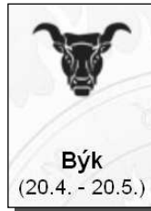
Býk (20.4. - 20.5.)

tornou zmenou a svoje okolie možno viackrát prekvapíte. Konečne si však budete vedieť vyselektovať úprimných priateľov od falošných neprajníkov a tých druhých bez mihnutia oka zatratíte. Vďaka tomu ušetríte množstvo energie. Ako celok bude rok 2014 pre vás mimoriadne priaznivý, v júni a júli dosiahnete vrchol úspechov a zvyšné mesiace s prehľadom dotiahnete všetky svoje projekty do dokonalosti. Pozor by ste si však mali dať na svoje zdravie, najmä v prvej polovici roka vás zrejme potrápi žalúdok. Preto by ste mali čo najskôr prehodnotiť svoje stravovacie návyky a všetkým podobným problémom predchádzať ešte skôr, než vzniknú.