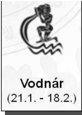
Vodnár (21.1. - 18.2.)

Rok 2014 bude najmä o impulzoch a poznaniach. Vôbec prvýkrát v živote vás začne lákať mystika ako taká a vďaka nej vám v srdci zavládne pokoj. Upnete sa na myšlienky a hviezdy a zrazu doteraz tak veľké problémy, už nebudú