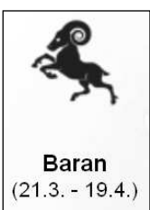
Baran (21.3. - 19.4.)

Rok 2014 bude o vašom spoločenskom živote, ktorý naberie na obrátkach najmä v druhej polovici a za tým všetkým sa vlastne skrýva vaša rastúca túžba po slobode. Je dôležité si to uvedomiť, lebo inak vám hrozí niekoľko prešlapov, ktoré vás budú neskutočne mrziť. Na začiatku roka vás prepadne menšia depresia a sklznete do obdobia sebaľútosti a neustále tápania po odpovedi na otázku prečo. Riešením by mohla byť práca, ak sa na ňu upnete a zaberie, vysnívaný úspech a uznanie už niekedy v máji, vám dvihne náladu a dodá novú pozitívnu energiu. To je presne ten zlom, ktorý vás očiči a vy si začnete užívať. Leto bude plné dobrodružstiev a nových známostí, no ak si dovoľíte príliš uľietnuť, tak si zarobíte nielen na pekný problém v citovej oblasti, ale zanedbáte svoju rodinu a starých priateľov, čo bude mať za následok ochladenie vzájomných vzťahov. Hviezdy vám v tomto roku nedoprajú vo financiách, preto sa úplne vyhnite investíciám aj náročným obchodným transakciám. Vaše zdravie neohrozia žiadne ochorenia, ale uškodíte si závislosťami. Ak nezpracujete na svojej pevnej vôli, prepadneť viacerým neudhom.